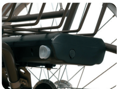
BAT 9 - Extra batterij E-bike (9A)