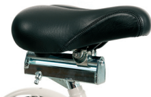
P4 - Zadel verstelbaar in diepte (140 mm)