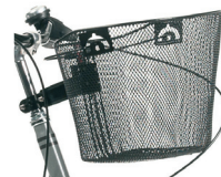
E14 - Inkoopmand