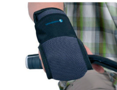
E11 - Gesloten handfixatie met Velcro