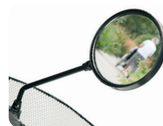
E8 - Spiegel