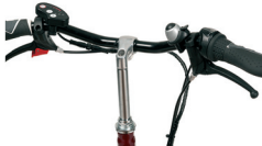
S2 - Plat stuur