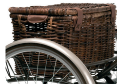
Optie: E4 Transportmand - Vintage