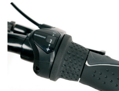
O3 - 3 versnellingen O7 - 7 versnellingen