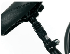
P5 - Zadelbuis met veren