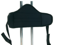
P1 - Heupsteun