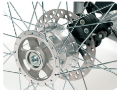
B1 - Remschijf achterwiel