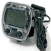
E3 - Kilometer teller