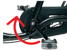
O2 - Terugtraprem