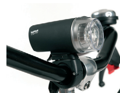
E2 - Verlichtingskit