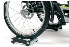
E13 - Hometrainer