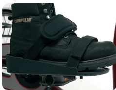
F3 - Pedaal voetplaat met Velcro