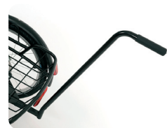
E1 - Duwstang (335 mm of 605 mm)