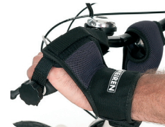
E10 - Hand en polsexfixatie met Velcro