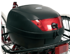
E5 - Topcase met slot volume: 30 liter