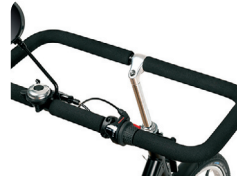
S4 - Rechthoekig stuur