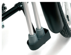
E6 - Krukkenhouder