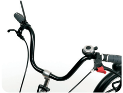
S1 - Klassiek stuur