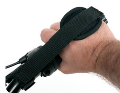
E9 - Handfixatie met Velcro