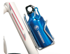
E7 - Bekerhouder (beker niet inbegrepen)