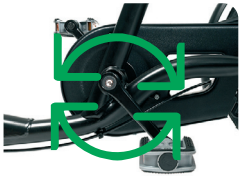
O6 - Vast tandwiel