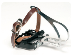
F2 - Pedaal met voethaak