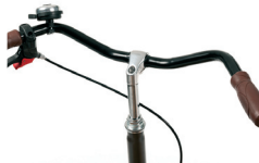
S3 - "City" stuur