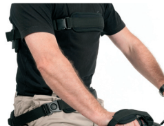
P3 - Heup en rugsteun