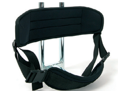
P2 - Rugsteun