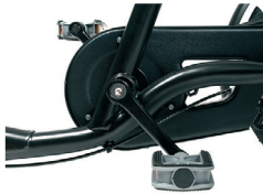
O1 + B1 - Vrijloop