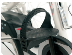
F1 - Pedaal met voetriem