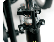
D1 - Stuurrichting begrenzer