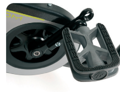
F5 - Trapstang regelbaar in lengte (22 mm)