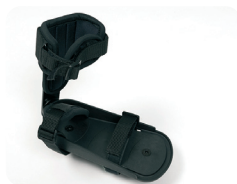
F4 - Pedaal voetplaat met beenklem en Velcro