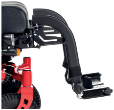
B06 Afneembare en wegdraibare voetsteunen