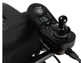
SE08 Besturing achteraan