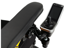
SE53 Wegzwenkbare besturing