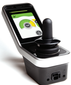
LINX LCD Besturing met LCD scherm