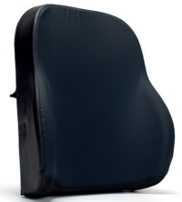
L34 Voorgevormde afneembare rug SOFT