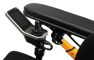
S53A - Wegdraibare besturing met vergrendelposities