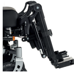
BZE Elektrische lengtecorrigerende comfort beensteunen