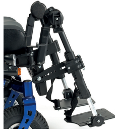
BZ7/BZ8 Lengtecorrigerende comfort beensteunen lang/kort