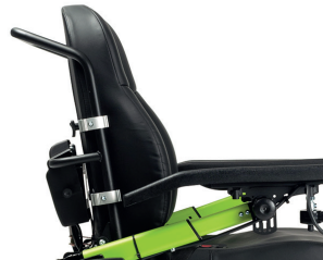
TUB + L34 Buisvormige voorgevormde rug met verstelbare aluminium klemmen