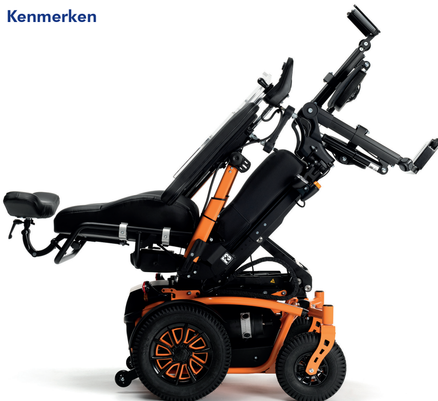
Elektrisch aangedreven inclinatie van de rugleuning en zitting