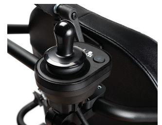
SE09 - Dubbele besturing (begeleider)