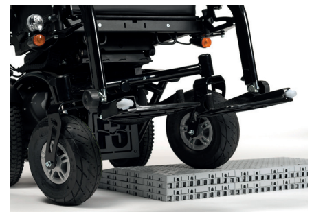
Roterende as voor constant grondcontact op alle wielen