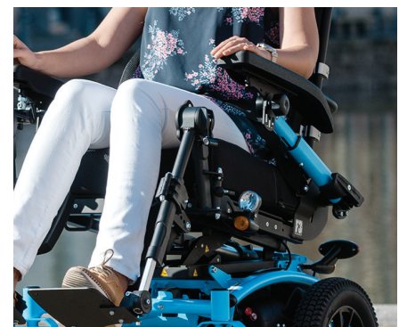
Verstelbare en opklapbare armleuningen met geheugenpositie