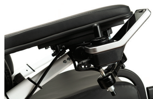
S53Z Wegzwenkbare besturing voor tafeltoegang