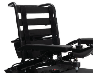
L44 Buizenframe met naspanbare rug